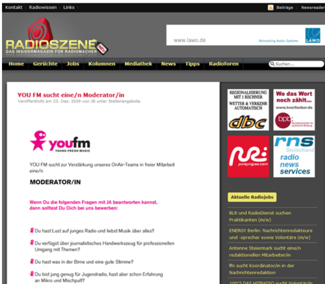
Beispiel-Stellenanzeige auf der RADIO SZENE

Die Jobbörse ist auf allen redaktionellen Seiten eingebunden. Die neuesten Stellenanzeigen sind auf der Startseite und allen Unterseiten sichtbar. Nach Schaltung erscheint Ihre Anzeige an oberster Position – gut sichtbar für alle Besucher.